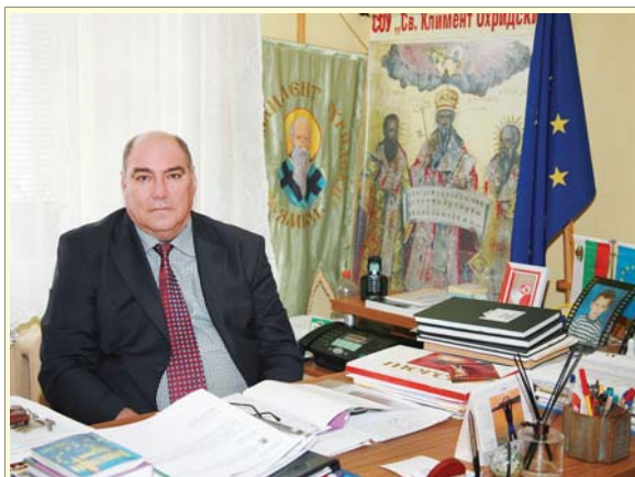
Скъпи ученици и колеги! Честит 24-ти май – празник на словото, празник на българския дух!

Едва ли има друг празник в българския календар, който да ни е повече близък и скъп. Той вълнува еднакво и първокласника, е белокосия пенсионер. Този ден има дълбоки корени в историята на народа ни, в личния живот на всеки от нас. Имената на двамата солунски братя Кирил и Методий вече толкова време не се изтриват от народната памет – ние ги изучаваме със свято благоговение и днес, във времето на далечни космически полети и точни електронни машини, когато е трудно да повярваш в съществуването на светци и божества. Защото тяхното дело, съхранено като икона през вековете, е просто и величаво, необходимо на славяните като вода и хляб, като въздух и светлина. Те изпълниха своя висок дълг пред жадния за своя писменост народ – сътвориха шепя букви и ги хвърлиха в дълбоката славянска нощ.